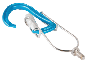
hlava- pro HECTOR a BORA karabiny W0024XX01