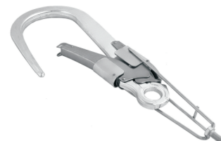
hlava- pro GIGA karabiny W0024XX03