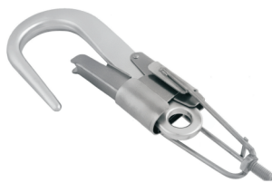
hlava- pro BIG karabiny W0024XX02