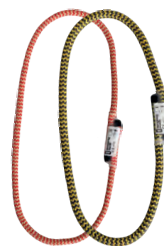
PRUSIK SLING W2601R085