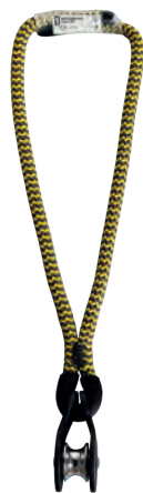
PULLEY SLING W2603YB00