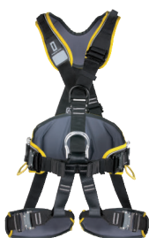
PROFI WORKER 3D SPEED