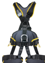
PROFI WORKER 3D STANDARD