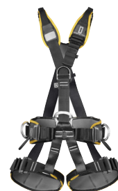
PROFI WORKER III