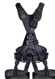
PROFI WORKER 3D STANDARD black