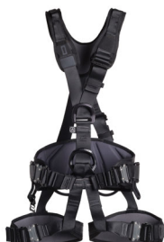
PROFI WORKER 3D SPEED black