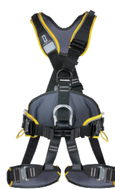
PROFI WORKER 3D SPEED