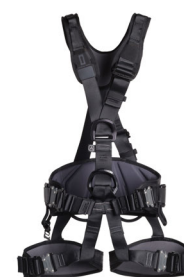
PROFI WORKER 3D SPEED black