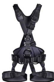
PROFI WORKER 3D STANDARD black