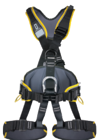
PROFI WORKER 3D STANDARD