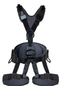
EXPERT 3D STANDARD black