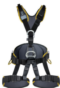
EXPERT 3D STANDARD