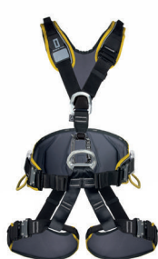
EXPERT 3D SPEED