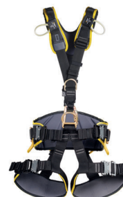
EXPERT 3D SPEED STEEL