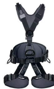
EXPERT 3D SPEED black